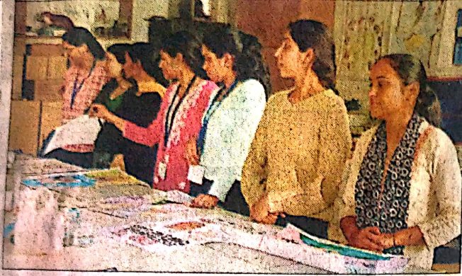
विक्रम बतरा कॉलेज पालमपुर में कार्यक्रम में भाग लेते छात्र।

पालमपुर (कांगड़ा)। शहीद कैप्टन विक्रम बतरा राजकीय महाविद्यालय में क्षय रोग (टीबी) जागरूकता एवं मानसिक स्वास्थ्य पर कार्यक्रम हुआ। इस अवसर पर विद्यार्थियों में सामाजिक चेतना और संवेदनशीलता विकसित करने के उद्देश्य से कई रचनात्मक गतिविधियां करवाई गईं।