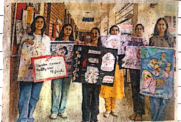
पालमपुर में टीबी जागरूकता कार्यक्रम में पोस्टर के साथ कॉलेज की छात्राएं।