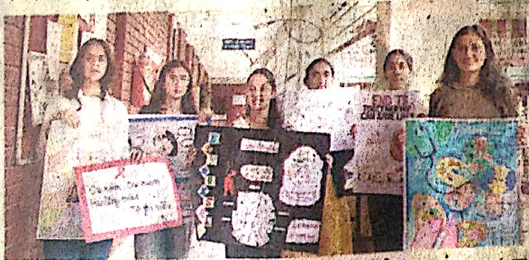
पालमपुर : कार्यक्रम के दौरान पोस्टर प्रदर्शित करती छात्राएं।

पालमपुर, 28 मार्च : शहीद कैप्टन विक्रम बत्रा राजकीय महाविद्यालय में क्षय रोग जागरूकता एवं मानसिक स्वास्थ्य पर कार्यक्रम का आयोजन किया गया। इस अवसर पर विद्यार्थियों में सामाजिक चेतना और संवेदनशीलता विकसित करने के उद्देश्य से कई रचनात्मक गतिविधियां आयोजित की गईं। टी.बी.