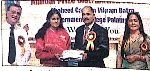
पालमपुर: कार्यक्रम के दौरान छात्रा को सम्मानित करते मुख्यातिथि